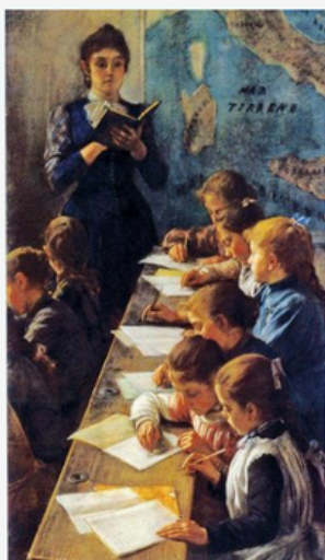
Demetrio Cosola, The Dictation Lesson , 1891*

*The Dictation Lesson (in Italian: Il dettato ) is a painting of Italian verismo painter Demetrio Cosola. The painting is housed in Turin Civic Gallery of Modern and Contemporary Art. It is a symbolic representation of the establishment of public education in the Kingdom of Italy immediately after unification, and the opening of schools to women, both as pupils and teachers.